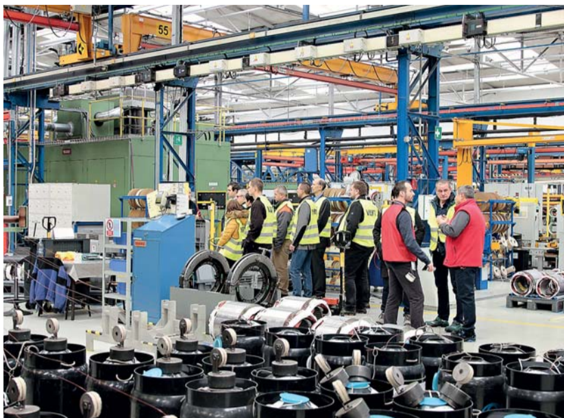
Zástupci firem oceněných titulem Bezpečný podnik absolvovali také prohlídku závodu na výrobu elektromotorů, kde se seznámili s novými směry v tomto odvětví a se zajištěním odpovídající úrovně BOZP.

V důsledku tohoto propojení se vytvoří inteligentní, distribuovaná síť různorodých entit podél celého řetězce vytvářejícího hodnotu, přičemž subsystémy pracují relativně autonomně a paralelně, navzájem podle potřeby komunikují. V tomto speciálním druhu provozu spolupracuje člověk s robotem a sdílí s ním společný pracovní prostor. I když jsou v tomto provozu dodrženy všechny směrnice a normy, vždy existuje tzv. zbytkové riziko, kde nebezpečí musí být řešeno individuálně s posouzením rizika pro specifickou oblast. Bezpečnost při řízení výroby na robotizovaném pracovišti musí být zajišťována pomocí nových metod posouzení rizik, nových metodických postupů, využíváním virtuální a rozšířené reality atd.