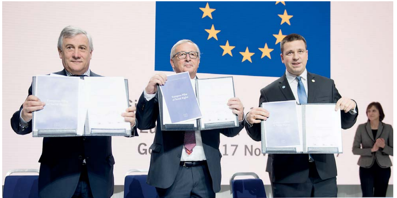
Antonio Tajani President of the European Parliament

Evropský parlament, Rada a Evropská komise na summitu vyhlásily Evropský pilíř sociálních práv, jenž je symbolem společného závazku. „Evropský sociální model se ukázal jako úspěšný a Evropa je díky němu skvělým místem pro život a práci. Dnes naše společné hodnoty potvr-