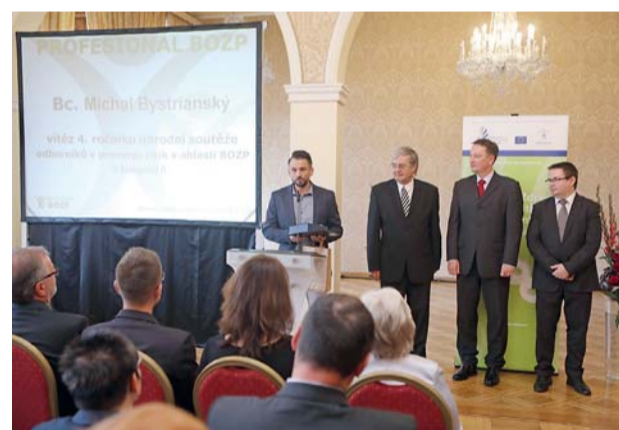
Cena byla předána vítězi letošního ročníku národní soutěže odborníků v prevenci rizik v oblasti BOZP tradičně v pražském Kaiserštejnském paláci.