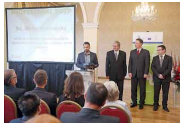
Cena byla předána vítězi letošního ročníku národní soutěže odborníků v prevenci rizik v oblasti BOZP tradičně v pražském Kaiserštejnském paláci.