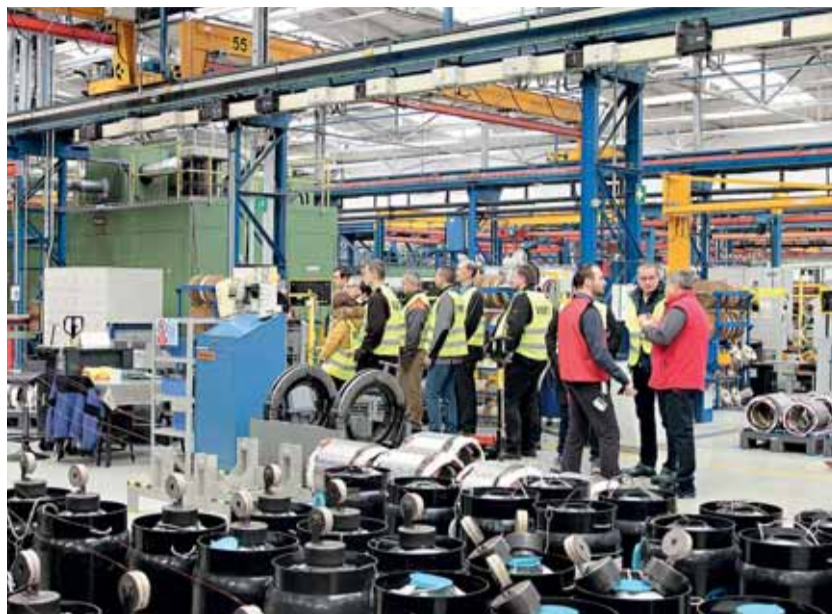
Zástupci firem oceněných titulem Bezpečný podnik absolvovali také prohlídku závodu na výrobu elektromotorů, kde se seznámili s novými směry v tomto odvětví a se zajištěním odpovídající úrovně BOZP.

V důsledku tohoto propojení se vytvoří inteligentní, distribuovaná síť různorodých entit podél celého řetězce vytvářejícího hodnotu, přičemž subsystémy pracují relativně autonomně a paralelně, navzájem podle potřeby komunikují. V tomto speciálním druhu provozu spolupracuje člověk s robotem a sdílí s ním společný pracovní prostor. I když jsou v tomto provozu dodrženy všechny směrnice a normy, vždy existuje tzv. zbytkové riziko, kde nebezpečí musí být řešeno individuálně s posouzením rizika pro specifickou oblast. Bezpečnost při řízení výroby na robotizovaném pracovišti musí být zajišťována pomocí nových metod posouzení rizik, nových metodických postupů, využíváním virtuální a rozšířené reality atd.