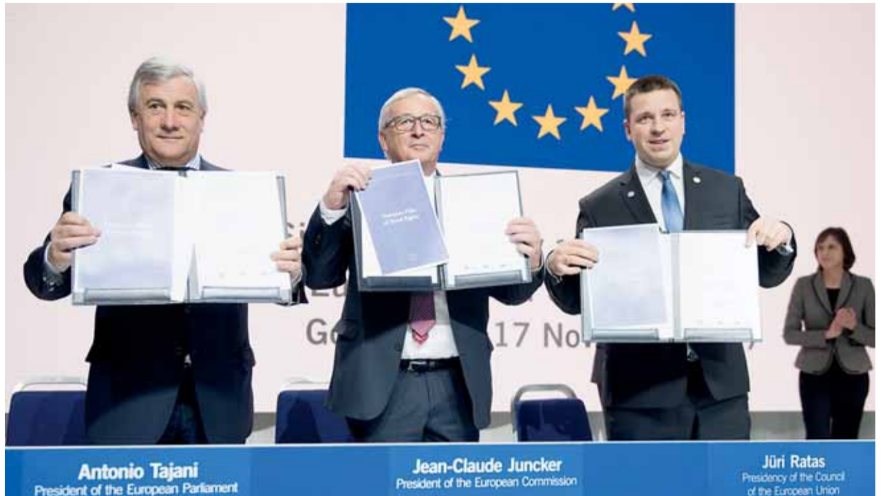
Na sociálním summitu v Göteborgu byl oficiálně oznámen vznik Evropského pilíře sociálních práv. Dokument společně podepsali Jean-Claude Juncker za Evropskou komisi, předseda Evropského parlamentu Tajani a estonský premiér Ratas

Evropský parlament, Rada a Evropská komise na summitu vyhlásily Evropský pilíř sociálních práv, jenž je symbolem společného závazku. „Evropský sociální model se ukázal jako úspěšný a Evropa je díky němu skvělým místem pro život a práci. Dnes naše společné hodnoty potvr-