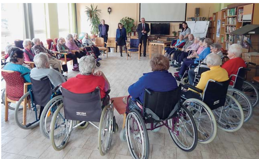
V Domě sociální péče v Kralovicích diskutovala náměstkyně Zuzana Jentschke Stöcklová se zaměstnanci zařízení i s jeho klienty.

Poslední zastávkou na pracovní cestě byl Domov klidného stáří v Zinkovech nedaleko Nepomuku. Zařízení je po rekonstrukci a v příjemném prostředí tu žije 103 seniorů, kteří mohou využívat jednolůžkové nebo dvoulůžkové pokoje. (tz)