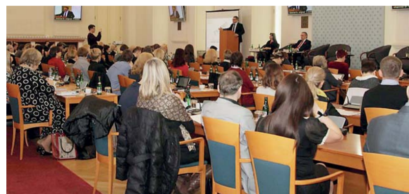
Konference 22 % k rovnosti se konala v pražském Černínském paláci.

Rozdíl v odměňování žen a mužů činí v České republice 22,5 procenta. V otázkách rovného odměňování je Česká republika druhou nejhorší