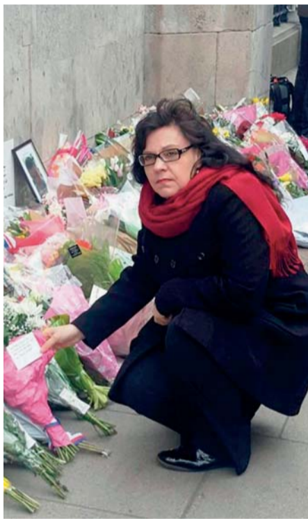
Sustainability Summit 2017 odstartoval jen několik hodin po teroristickém útoku. Michaela Marksová proto na místě nešťastí uctila památku obětí útoku a vyjádřila solidaritu se všemi obyvateli britské metropole.

V rámci summitu se setkávají zástupci vlád, akademické sféry i nadnárodních společností k diskusi nad vhodnými strategiemi pro dlouhodobě udržitelný rozvoj. Ve svém vystoupení na summitu se ministryně Michaela Marksová zaměřila na sociální aspekty globálního úsilí o ochranu klimatu a udržitelný rozvoj, zejm. změny struktury zaměstnanosti (např. s ohledem na snižování těžby fosilních paliv, tedy rekvalifikační programy pro horníky, a změny na trhu práce spojené s postupem automatizace a robotizace). (tz)