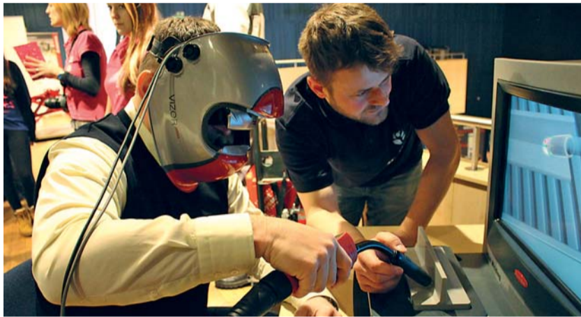
Jednou z vyhledávaných atrakcí jablonecké Živé knihovny povolání bylo virtuální svařování. Závěreční si tak mohli přímo na místě vyzkoušet profesi svářeče.