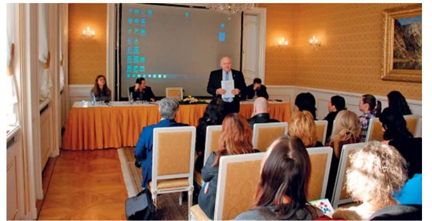
Na konferenci, kterou pořádaly Agentura pro sociální začleňování a Armáda spásy ČR, sdíleli odborníci své zkušenosti z oblasti sociální práce v systému sociálního bydlení.

Na odborné konferenci, která se konala 14. února, byly prezentovány praktické zkušenosti se zaváděním a rozvojem systémů sociálního bydlení v České republice.