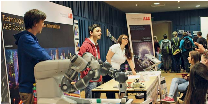
Na akci byl také vystaven unikátní robot, který sdílí pracovní proces s člověkem, aniž ho ohrožuje. Návštěvníci měli možnost diskutovat se specialistou, který robota programuje.

V dalším, v pořadí už třetím městě Libereckého kraje se uskutečnila Živá knihovna povolání. Tentokrát se mohli školou povinní poradit o výběru vhodné profese 15. února v Jablonci nad Nisou.