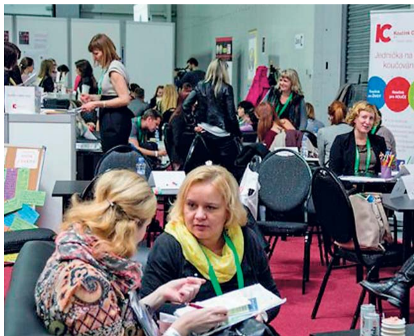
Návštěvníci veletrhu pracovních příležitostí Profesia days měli jedinečnou příležitost setkat se s personalisty předních zaměstnavatelů v ČR a zjistit možnosti pracovního uplatnění.

I když nezaměstnanost v ČR klesá, zájem o veletrh Profesia days 2016, který se uskutečnil 12. a 13. října na výstavišti v pražských Letňanech, byl ze strany návštěvníků opravdu velký.