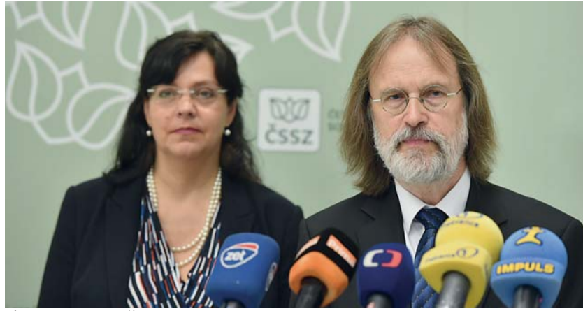
Ústřední ředitel České správy a sociálního zabezpečení Jiří Biskup chce posilovat reputaci ČSSZ jako spolehlivého, efektivního a klientsky orientovaného úřadu, který dokáže ve prospěch klientů využívat výhody moderních informačních a komunikačních technologií.

Důchodová kalkulačka neumožňuje provést informativní výpočet u „zvláštních“ starobních důchodů, jako je např. tzv. hornický důchod, nelze na ní vypočítat ani výši jiných druhů důchodů – invalidních či pozůstalostních. On-line důchodová kalkulačka slouží pouze pro výpočet starobních nebo předčasných starobních důchodů. Jejím spuštěním ČSSZ dále rozšiřuje nabídku služeb na podporu informovanosti budoucích starobních důchodců. Kalkulačka je určena lidem,