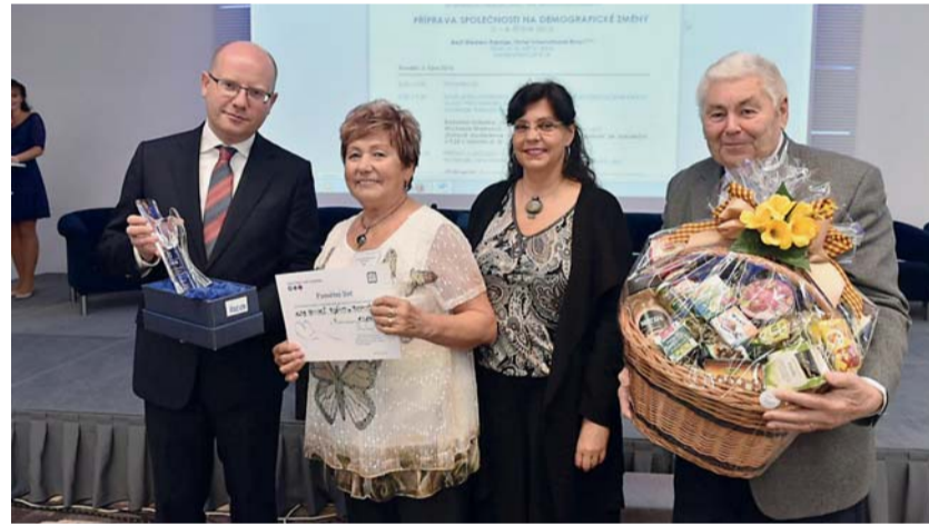
Oceněným předali Cenu Rady vlády pro seniory a stárnutí populace ministryně práce a sociálních věcí Michaela Marksová a premiér Bohuslav Sobotka.

Na mezinárodní konferenci Příprava společnosti na demografické změny byli v Brně 3. října oceněni senioři, kteří ve svém volném čase obětavě pomáhají ostatním.