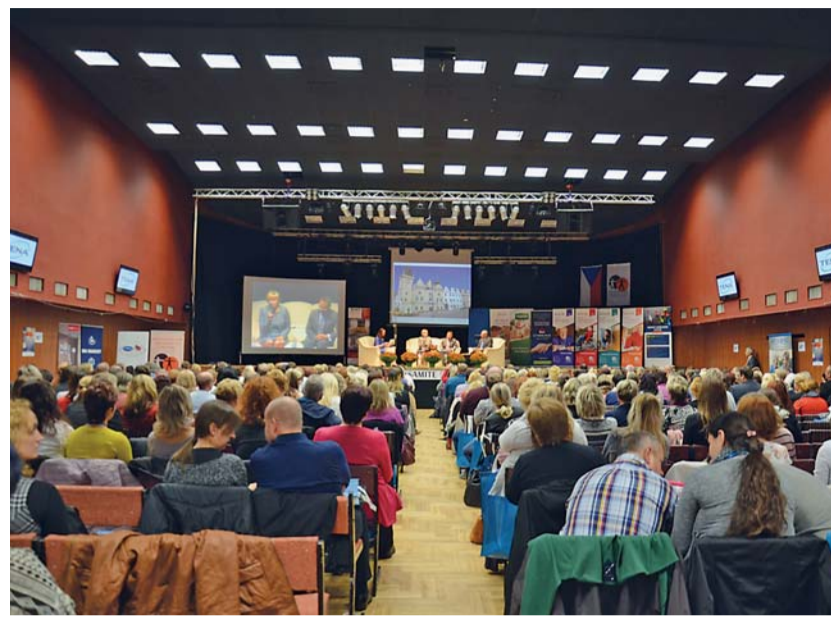
Na letošní výroční kongres poskytovatelů sociálních služeb ČR pořádaný Asociací poskytovatelů sociálních služeb 6. a 7. října v Táboře zavítalo na 700 účastníků.

Předělem mezi kongresovými dny byl tradiční galavečer. Prvním bodem večera bylo slavnostní předávání certifikátů Značky kvality v sociálních službách. Certifikáty převzaly Spokojený domov, o. p. s., Mnichovo