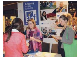
U stánku Ministerstva práce a sociálních věcí, označeného logem Evropského sociálního fondu, získali zájemci informace o možnostech podpory z Operačního programu Zaměstnanost a podrobnosti k aktuálním výzvám.

Na veletrhu se prezentovalo přes dvě stě neziskových organizací nejrůznějšího zaměření. Pestrý program přednášek a workshopů doplnila napínavá interaktivní hra Unik do bezpečí, která prověřila týmovou spolupráci i důvtip návštěvníků veletrhu, ale především dala nahlédnout