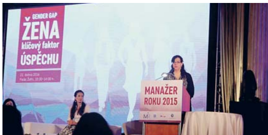
Ministryně práce a sociálních věcí Michaela Marksová na konferenci mj. připomněla, že ženy tvoří 61 procent osob absolvujících vysoké školy, ale česká společnost využívá tento potenciál velmi nedostatečně.

Pražský Žofín hostil 21. dubna účastníky konference Gender Gap: Žena – klíčový faktor úspěchu, věnované problematice rozdílného odměňování žen a mužů a postavení žen na současném trhu práce.