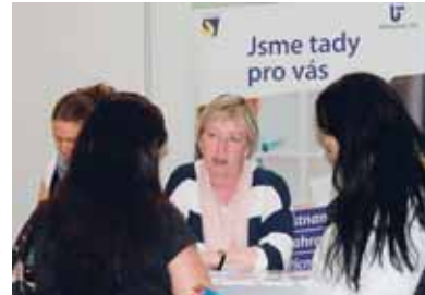
Poradci ze sítě EURES informovali návštěvníky veletrhu o možnostech pracovního uplatnění v zahraničí.

Veletrhu se zúčastnili poradci EURES z České republiky, ale také jejich kolegové z Dánska, Itálie, Německa, Nizozemska, Slovenska a Švédska. Uchazečům nabízejí informace o životních a pracovních podmínkách v jednotlivých zemích, ale také ověřená volná pracovní místa v různých oborech. Za