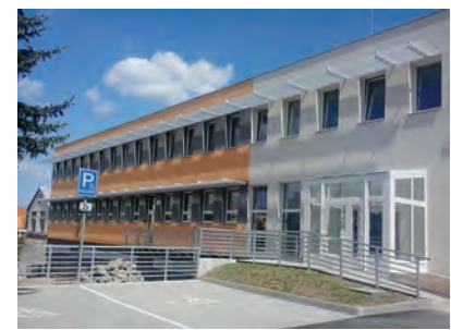
Novou administrativní budovu Úřadu práce ČR najdete v Jihlavě v ulici Brtnická 21 (budova B).

Nové a moderní prostory pro klienty i zaměstnance Krajské pobočky a Kontaktního pracoviště Úřadu práce ČR v Jihlavě, většinu služeb na jednom místě, bezbariérový vstup a mnohem lepší dostupnost. To vše nabízí nová administrativní budova, která veřejnosti slouží od pondělí 22. června na adrese Brtnická 21 (budova B). Do nových prostor se přestěhovala oddělení zprostředkování a oddělení evidence a podpor v nezaměstnanosti. Vzhledem k tomu, že na stejné adrese v budově A sídlí úřad dlouhodobě, budou tak na jednom místě klientům k dispozici stěžejní agendy Úřadu práce ČR – tedy zaměstnanost i nepojistné sociální dávky. O týden později se do uvolněných prostor ve staré budově A přestěhovali zaměstnanci, kteří mají na starost dávky pomoci v hmotné nouzi a dávky pro osoby se zdravotním postižením. Pracoviště státní sociální podpory zůstává na původní adrese (Tolstého 15) beze změny. „Díky soustředění