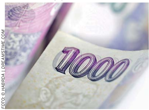
Srážky z dávek nemocenského pojištění v letech 2013 a 2014