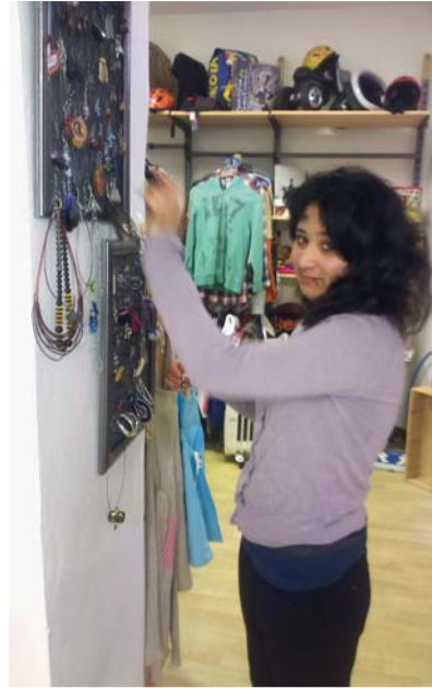
V Restart Shopu v pražské Biskupské ulici získávají potřebnou pracovní praxi klienti nízkoprahových zařízení pro děti a mládež.

Česká asociace streetwork, která projekt realizuje od začátku letošního roku, se inspirovala v Belgii, Nizozemsku a Anglii, kde poskytovatelé sociálních služeb takovátto pracoviště provozují zcela běžně. „Mladí lidé pocházející z jiného sociokulturního prostředí mají z důvodů své odlišnos-