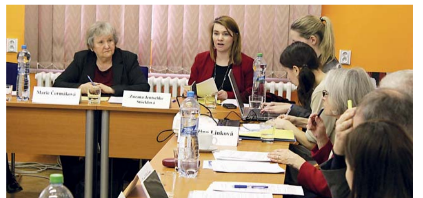
Odborná komise pro rodinnou politiku, složená ze zástupců Ministerstva práce a sociálních věcí ČR, Českého statistického úřadu, Výzkumného ústavu práce a sociálních věcí a z odborníků z oblastí sociologie, demografie či ekonomie, jednala 17. února mj. o lepší dostupnosti služeb péče o děti.