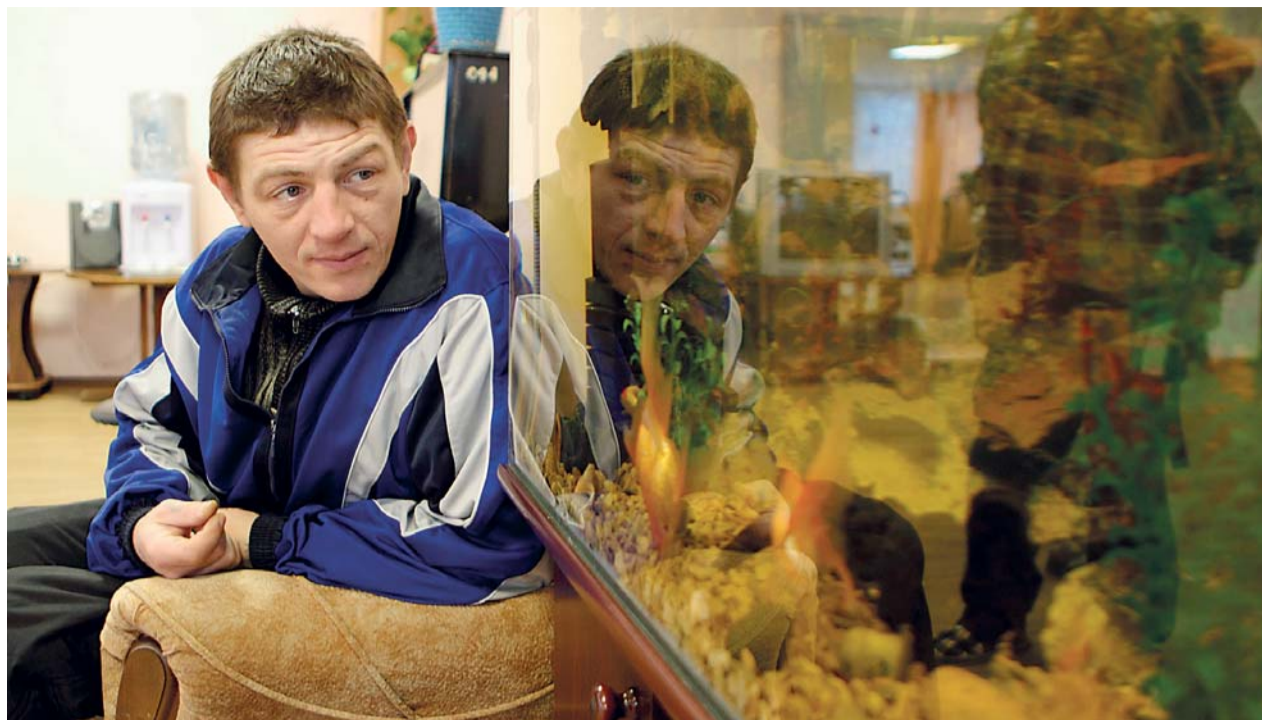
Díky transformaci dojde ke zkvalitnění sociálních služeb a lidé s postižením získají soukromí.

Na pilotní ověření nastavení procesu transformace plynule navázal projekt s prozaickým názvem Transformace sociálních služeb, financovaný z prostředků Evropského sociálního fondu prostřednictvím Operačního programu Lidské zdroje a zaměstnanost a ze státního rozpočtu ČR. Do projektu je zapojeno 40 zařízení z celé České republiky. Jeho cílem je především udržet a dále šířit transformační proces sociálních služeb. Na rozdíl od prvního projektu se zaměřuje zejména na vzdělávání formou workshopů, v zapojených zařízeních probíhají také konzultace a supervize a využívány jsou i kulaté