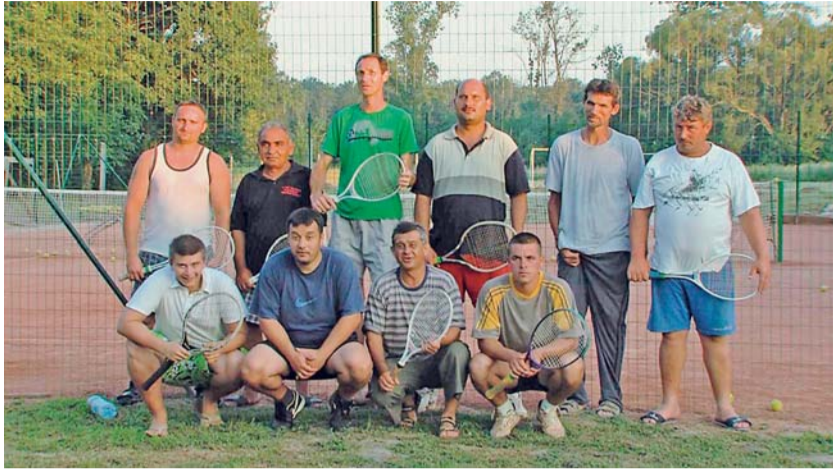
Jak se s extrémní nezaměstnaností snažili vypořádat v malé vesnici Besence v jižním Maďarsku, líčí dokumentární film Míčky a melouny .

V Praze 12. března končí 16. ročník Mezinárodního festivalu dokumentárních filmů o lidských právech Jeden svět, jehož hlavním tématem byla práce. Od 15. března do 13. dubna budou festivalové filmy k vidění v dalších 33 městech v ČR.