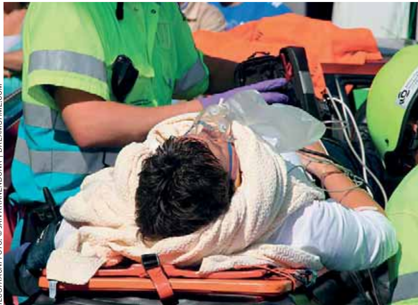
Povinnost zaměstnavatelů a OSVČ nahlásit orgánům inspekce práce vznik pracovního úrazu je stanovena v nařízení vlády č. 201/2010 Sb.

V roce 2007 byla uzavřena dohoda o spolupráci v oblasti bezpečnosti práce, technických zařízení a stanovených pracovních podmínek mezi Státním úřadem inspekce práce a Ministerstvem vnitra ČR. Kromě