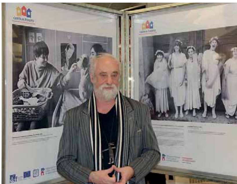
Autorem fotografií z cyklu Život místo ústavu je Jindřich Šreit, přední český dokumentární fotograf.

V březnu měli zájemci poslední možnost prohlédnout si v kladenském nákupním centru Oáza putovní výstavu fotografií Jindřicha Štreita s názvem Život místo ústavu, která byla součástí kampaně na podporu transformace sociálních služeb.