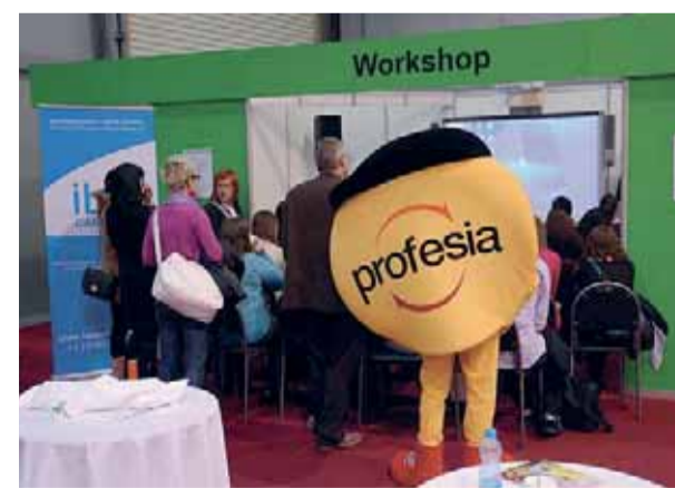
Návštěvníci veletrhu práce Profesia days 2012 se také mohli zúčastnit 61 přednášek nebo 32 workshopů.

Cílem veletrhu práce Profesia days 2012 bylo nejen nabídnout přímo na místě konkrétní pracovní pozice