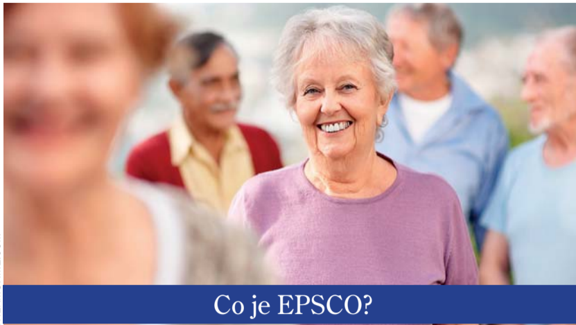
Co je EPSCO?

Rada pro zaměstnanost, sociální politiku, zdraví a ochranu spotřebitele EU (EPSCO) se na svém zasedání, které se konalo v Lucembursku 21. června, věnovala demografické situaci v Evropě a vydala dokument s doporučeními pro členské státy. Podpora by měla být směřována hlavně na větší účast seniorů na chodu společnosti a na trhu práce.