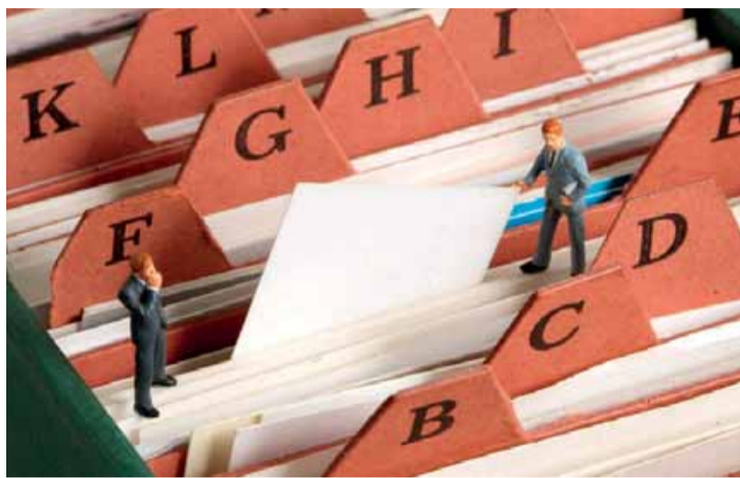
Zaměstnavatel je povinen mít v místě pracoviště kopie dokladů prokazujících legálnost práce (pracovní smlouvy, dohody o pracích konaných mimo pracovní poměr nebo jiné smlouvy).

kontrolní pracovník – inspektor při provádění kontrole. Nepředložení dokumentů zaměstnavatelem přímo v průběhu kontroly na daném pracovišti je inspektor povinen zaznamenat do protokolu o výsledcích kontroly jako výkon nelegální práce podle § 5 písmena e) zákona o zaměstnanosti. Dodatečné předložení dokladů nemá na toto hodnocení vliv. (TZ)