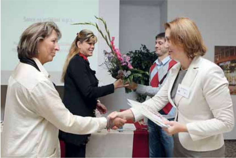
V loňském ročníku vyhrála Národní cenu kariérového poradenství organizace Šance na vzdělání, o. p. s. Zástupkyně společnosti přebírají ocenění.

Nezaměstnanost, diskriminace při hledání zaměstnání, spokojenost s pracovním životem a sladění pracovního a osobního života jsou stále častější skloňovanými tématy současnosti. Jejich společným jmenovatelem je kariérové poradenství.