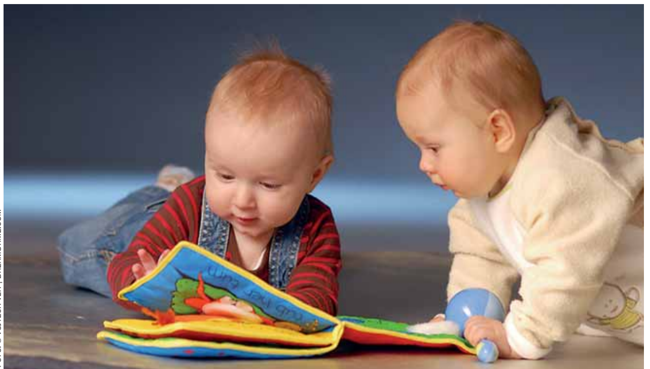
Kojenecké ústavy – tehdy a dnes

K projednání situace v oblasti péče o děti do tří let věku v ČR se 25. srpna 2011 na Ministerstvu práce a sociálních věcí ČR sešla mezinárodní skupina expertů. Jednání proběhla za účasti zástupce Světové zdravotnické organizace (WHO), Úřadu Vysoké komisařky OSN pro lidská práva (OHCHR), Výboru pro práva dítěte OSN, Mezinárodní federace péstounské péče (IFCO), odborníků z oborů pediatrie, neonatologie, psychologie i práva, zástupců MPSV a pracovníků z oblasti ústavní péče. MPSV zde mj. prezentovalo harmonogram kroků, které povedou k omezení, resp. následnému zrušení institucionální péče o děti do 3 let věku: 1. Vytvoření Národní strategie péče o ohrožené děti (termín předložit vládě do 31. října 2011). Národní strategie mimo jiné stanoví úkoly