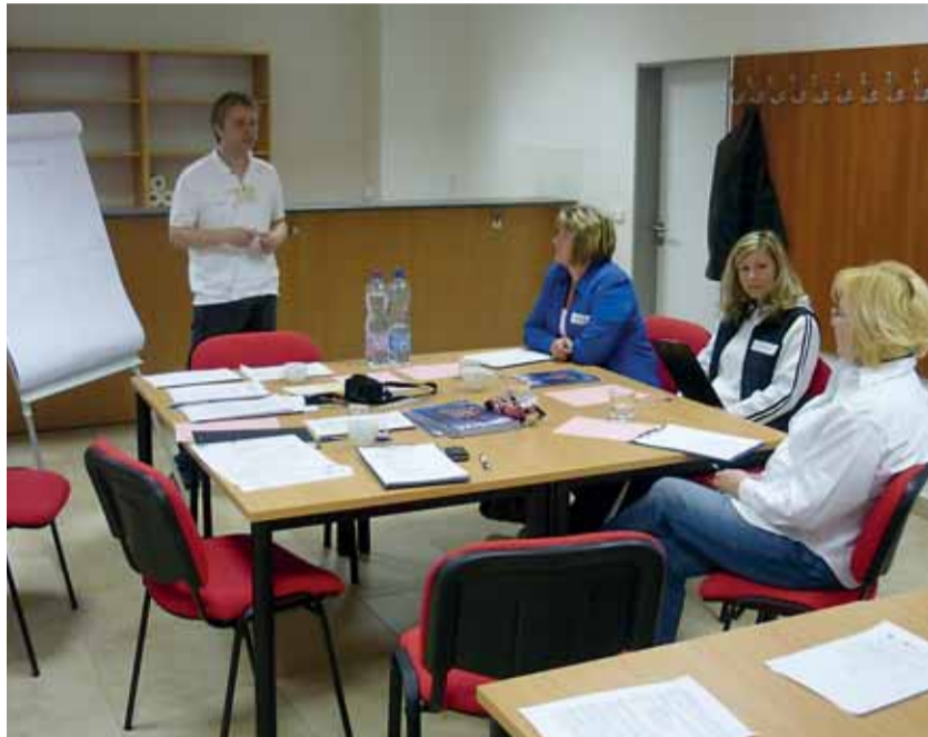
Agentura A-P-Z poskytuje firmám a organizacím informace o zaměstnávání osob se zdravotním postižením (snížení mzdových nákladů apod.) a zprostředkovává kontakt s vhodnými zájemci o práci.

Zkratka APZ možná znáte jako označení pro aktivní politiku zaměstnanosti, podporu uplatnění lidí znevýhodněných na trhu práce. Ze stejného principu vychází také projekt Ligy vozíčkářů s názvem Agentura A-P-Z. Zkratka ovšem znamená propojení činností (aktivizace – podpora – zaměstnání) směřujících na Znojensku a Jihlavsku k uplatnění lidí se zdravotním postižením v zaměstnání.