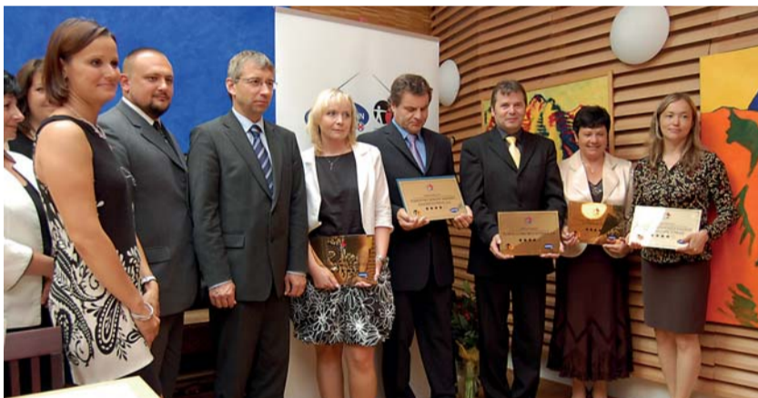
První domovy pro seniory získaly certifikáty kvality a zlaté tabulky s hvězdami, jejichž počet značí úroveň poskytovaných služeb.

V pražském Domově sociální péče Hagibor předal ministr práce a sociálních věcí Jaromír Drábek 21. června – u příležitosti úspěšného zakončení projektu Značka kvality v sociálních službách – certifikáty kvality prvním českým domovům pro seniory.