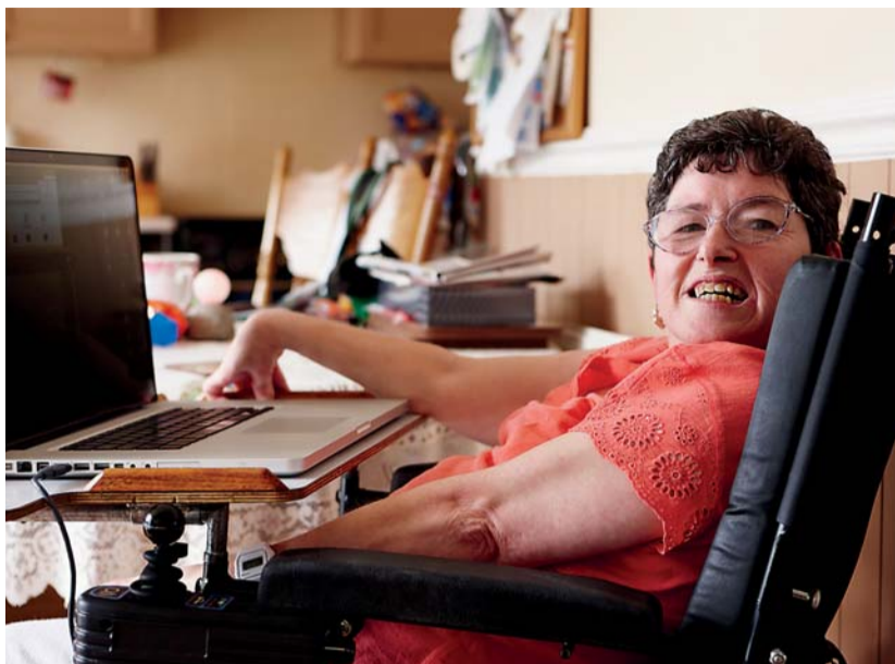
Mezi uživatele služby podporované zaměstnávání, kteří potřebují individuální a dlouhodobou podporu pro uplatnění na otevřeném trhu práce, patří zejména lidé s těžším zdravotním postižením.

Loni v září zahájila ČUPZ realizaci projektu Zavádění evropských trendů v oblasti zaměstnávání znevýhodněných osob do české praxe. Projekt, jehož zkrácený název zní Podporované zaměstnávání na cestě Evropou, je realizován v rámci Operačního programu Lidské zdroje a zaměstnanost. Jeho hlavním cílem je sdílení nových trendů a osvědčených nástrojů uplatňovaných v oblasti podporovaného zaměstnávání v Evropě, zejména v zemích zahraničních partnerů (tj. v Německu a Rakousku), a zprostředkování získaných informací zástupcům českých poskytovatelů podporovaného zaměstnávání, mimo jiné prostřednictvím vzdělávacích aktivit realizovaných v rámci projektu. Mezinárodní spolupráci rozvíjejí také pravidelná setkání