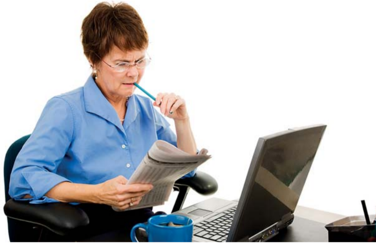
At' už jsou inzeráty nabízející volné pracovní pozice publikovány v tištěných médiích nebo na internetu, vždy by měly respektovat zásady pracovního práva, včetně rovného zacházení a zákazu diskriminace.

Obecný zákaz diskriminace předpokládá, že je nabídka práce určena uchazečům bez ohledu na věk. Jestliže z inzerátu vyplývá, že je hledán uchazeč určitého věku nebo do určitého věku, jedná se o přímou diskriminaci. Přípustné je rozdílné zacházení sloužící k ochraně osob mladších 18 let, vyžadující minimální věk či praxi pro zaměstnání, v němž