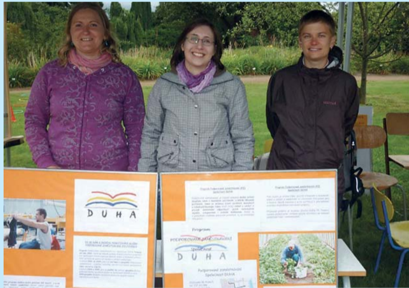
Tým programu Podporované zaměstnávání ve Společnosti DUHA při jedné z prezentací projektu Operačního programu Praha – Adaptabilita (OPPA).