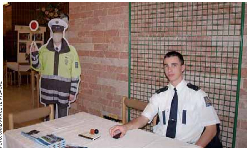
Mezi dvanácti reprezentanty profesí Živé knihovny povolání byl i policista.