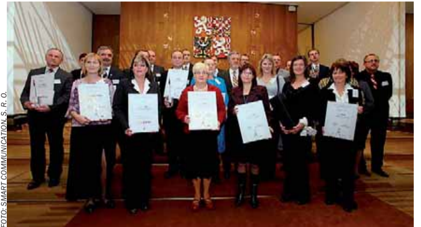
Slavnostní vyhlášení výsledků celostátní soutěže Obec prospěšná rodině proběhlo 25. listopadu v prostorách Poslanecké sněmovny Parlamentu ČR za účasti ministra práce a sociálních věcí Petra Šimerky.

inspirovat ty, které teprve začínají a snaží se na svém rozvoji pracovat. V pořadí druhý ročník soutěže Obec přátelská rodině přinesl řadu změn a novinek. Kromě výraznějšího zacílení soutěže na celou rodinu včetně seniorů a rozšíření oceňovaných pozic je to také vznik nové ceny v podobě originální skleněné plastiky pro vítěze.