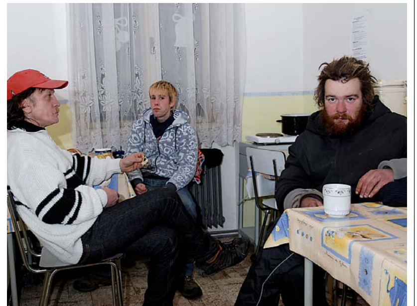
Každý rok využije služeb Domu Naděje v Jablonci n. N. přibližně 200 klientů.

Ke dni otevřených dveří během Týdne sociálních služeb se připojil i Dům Naděje v Jablonci nad Nisou. Každý, kdo přišel na návštěvu, si mohl prohlédnout téměř všechny prostory včetně kanceláří a ubytovacích místností. Pracovníci Naděje byli připraveni zodpovědět jakékoliv dotazy a seznámit návštěvníky s celým provozem zařízení.