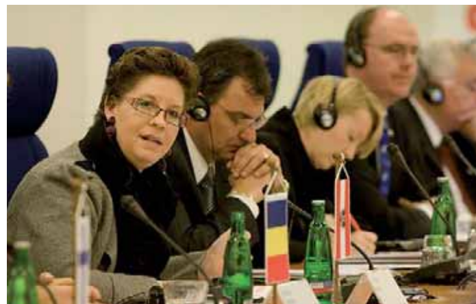
Christine Marek, státní tajemnice rakouského Spolkového ministerstva hospodářství, vysvětlovala postoj našich jižních sousedů na problematiku předškolní péče.