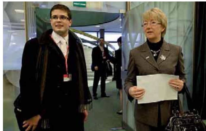
Irské ministryni sociálních věcí a rodiny Mary Hanafin pomáhal zorientovat se v zasedacím pořádku jeden z organizátorů.