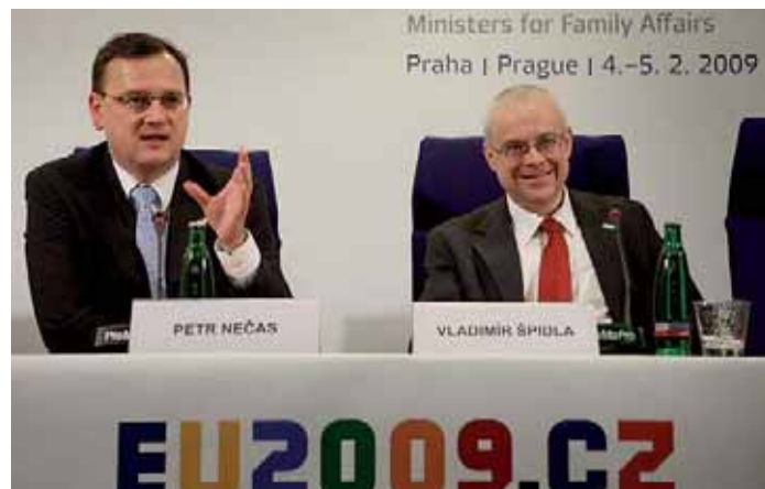
Po skončení zasedání vysvětlovali přínos setkání ministrů zemí EU pro rodinné otázky na tiskové konferenci ministr práce a sociálních věcí Petr Nečas a evropský komisař pro zaměstnanost, sociální věci a rovné příležitosti Vladimír Špidla.