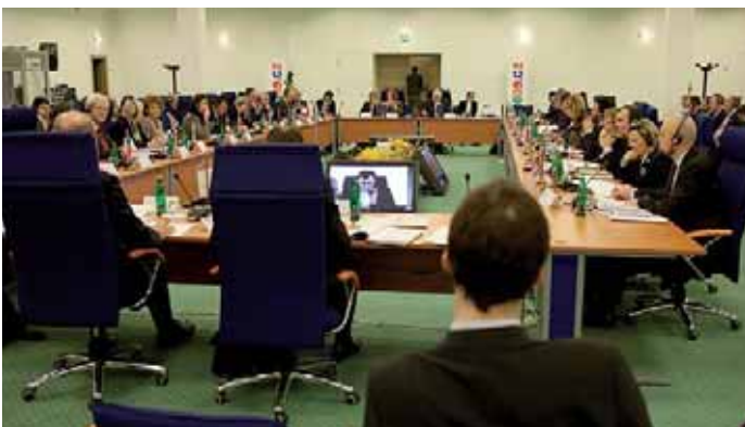
Ministři diskutovali na téma barcelonské cíle v předškolní péči o děti se zohledněním nejlepších zájmů dítěte a rané péče o něj v Kongresovém centru Praha.