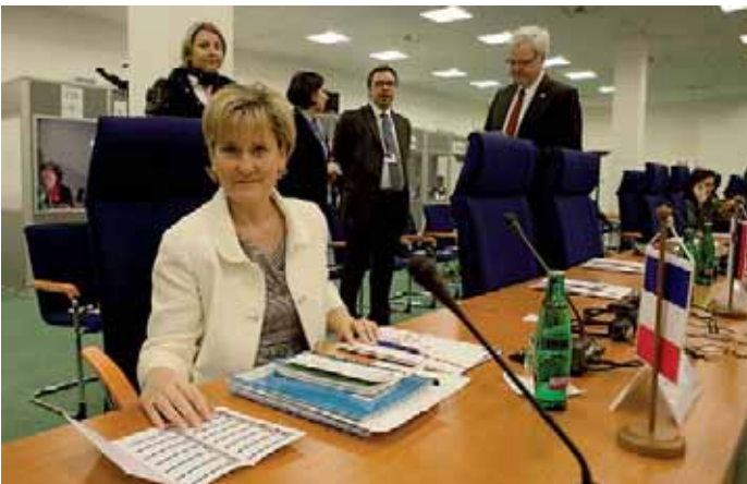
Na pražském zasedání nechyběla ani šarmantní Nadine Morano, francouzská státní tajemnice zodpovědná za rodinu.