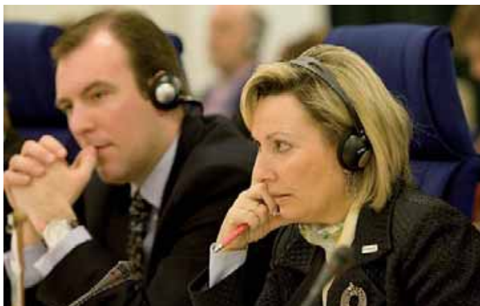
Názorům svých kolegů na rodinnou politiku naslouchala španělská náměstkyně předsedy vlády pro sociální politiku Amparo Valcarce i její belgický protějšek Melchior Wathelet.