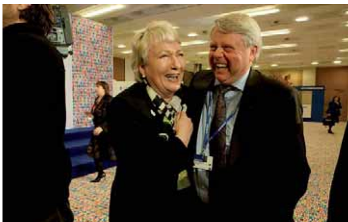
Že při neformálním zasedání ministrů pro rodinné otázky nepanovala i přes některé odlišné názory dusná atmosféra, dosvědčuje tento snímek finské ministryně sociálních věcí a zdraví Liisy Hyssälä.