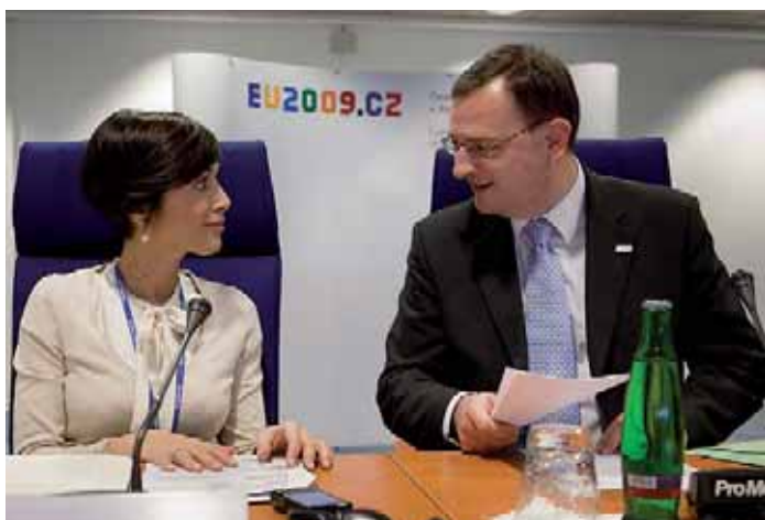
Navazující konference Rodičovská péče o děti a politika zaměstnanosti – kolize, nebo komplementarita? se zúčastnila vedle českého ministra i Mara Carfagna, italská ministryně pro rovné příležitosti a rodinu.