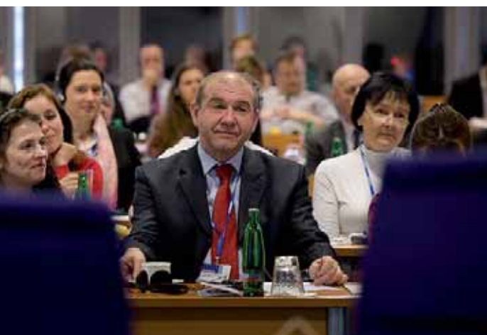
Postoje Ministerstva práce a sociálních věcí ČR prezentoval na konferenci také Marián Hošek, náměstek ministra pro sociální služby, veřejnou správu a sociálněprávní ochranu.