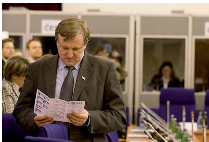
I litevský ministr sociálního zabezpečení a práce Rimantas Dagys uvítal brožuru Who is Who (Kdo je kdo), která byla pro lepší identifikaci účastníků při této příležitosti vydána.