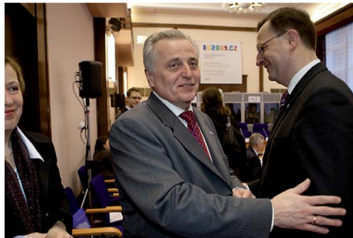
Na českém ministrovi práce a sociálních věcí a jeho rakouském protějšku – ministrovi sociálních věcí a ochrany spotřebitelů Rudolfu Hundstorferovi – byla vidět dobrá nálada.