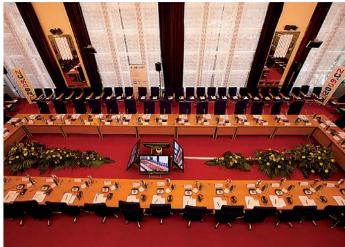
Pracovní část setkání Rady pro zaměstnanost a sociální věci se konala v luhačovicím Společenském domě.

Během dvou dnů pracovního jednání (22. a 23. ledna) v Luhačovicích se ministři pro zaměstnanost a sociální věci zemí Evropské unie a další unijní odborníci věnovali diskusi o jednotlivých aspektech mobility. V několika snímcích vám chceme přiblížit atmosféru setkání a doložit, že Luhačovice byly důstojným hostitelským městem.