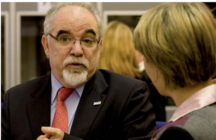
Jak je možno vidět na klopě saka portugalského ministra práce a sociální solidarity José Vieira da Silvy, účastníci setkání si logo českého předsednictví oblíbili.