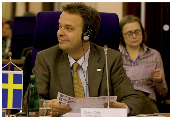
S příspěvkem k tématu mobility osob na okraji trhu práce vystoupil také švédský ministr pro zaměstnanost Sven Otto Littorin.