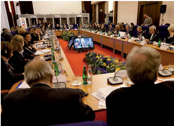
Diskuse ministrů a odborníků z řad unijních institucí probíhala ve třech tematických blocích: profesní mobilita, geografická mobilita a mobilita osob na okraji trhu práce.