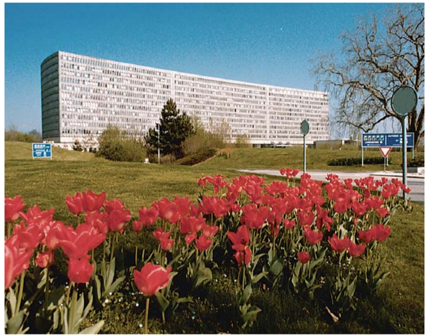
Sídlo Mezinárodní organizace práce (ILO) ve švýcarské Ženevě.