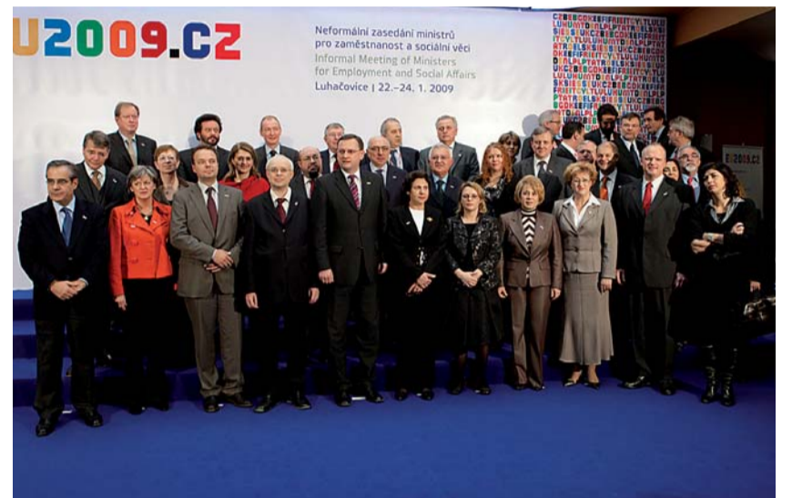
Na závěr pracovního setkání ministrů práce a sociálních věcí zemí EU a dalších unijských odborníků v Luhačovicích proběhlo společné focení.

Positivní zpráva přišla z Dánska a také Belgie. Dánsko už oznámilo, že chce plně otevřít svůj pracovní trh v květnu, Belgie o tom uvažuje.