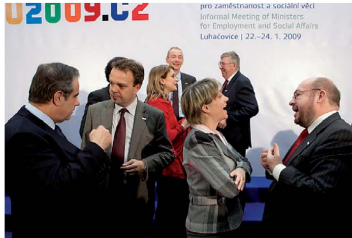
Že ministři a zástupci unijních institucí nevynechali v Luhačovicích žádnou vhodnou příležitost k vysvětlování svých postojů, dokládá tento snímek.