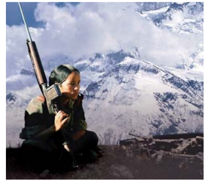
Z filmu Bojovnice v sári

„V letošním roce jsme se rozhodli reflektovat zásadní globální výzvy současného světa. Jakkoli máme vynikající filmy o Barmě, Íránu, Kašmíru, Dárfúru, Ekvádoru, Venezuele, Kongu či Severní Koreji, letošní ročník není o partikulárních tématech. Nosná témata letošního ročníku jsou voda, nafta, plyn, energetika, oteplování, ekonomika a finanční krize. Věci, které nás v České republice, ale i lidi