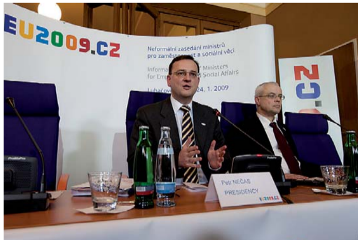
Ministr práce a sociálních věcí ČR Petr Nečas a eurokomisař Vladimír Špidla odpovídali na dotazy novinářů na tiskové konferenci po skončení prvního dne pracovního zasedání.