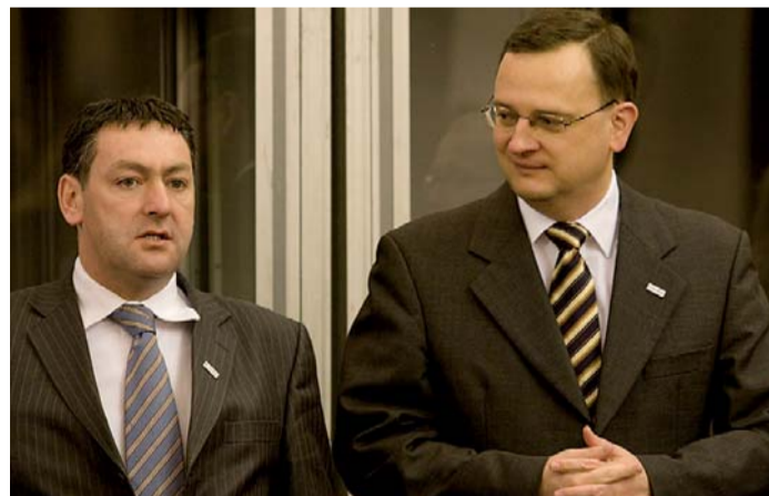
Irský ministr práce Billy Kelleher ve společnosti hostitele – českého ministra práce a sociálních věcí Petra Nečase.