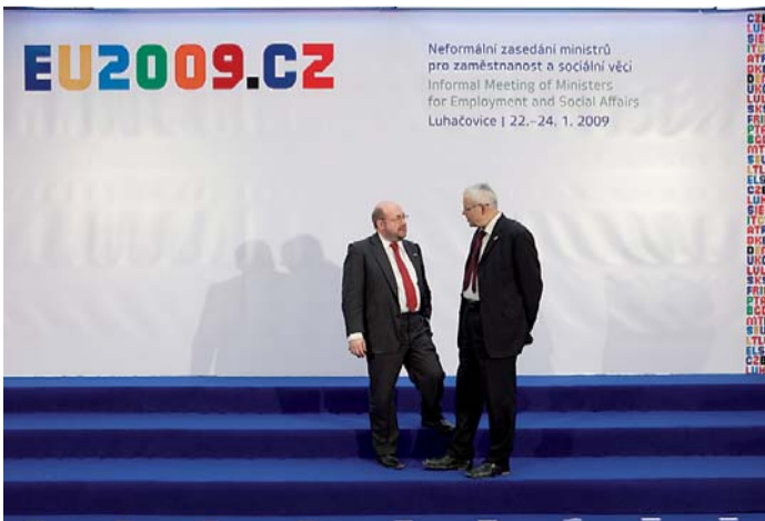
První na společné focení dorazili eurokomisař Vladimír Špidla a lucemburský ministr François Biltgen.