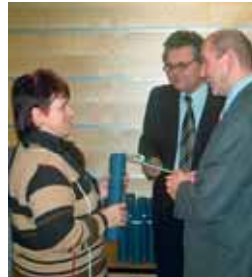
Nejlepším účastnicím prvního běhu projektu Vzdělávání pro pracovníky sociální péče byly na půdě Ministerstva práce a sociálních věcí ČR předány diplomy.