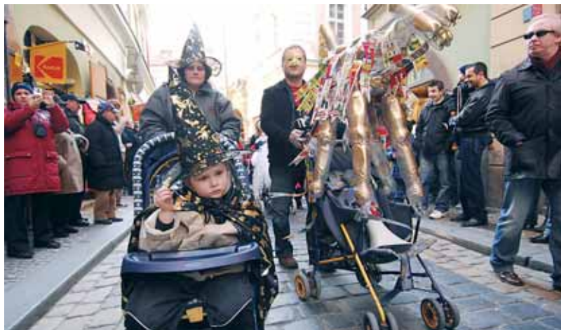
Ze Staroměstského náměstí v Praze vyšel 17. 2. masopustní průvod s alegorickými kočárky pořádaný Síti mateřských center. Ještě před tím posílil Clam-Gallasův palác zájem účastníků, kteří se tu mohli převléci, obersvit a také vytvořit si vlastní masku.