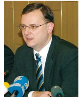
vajícího zákona by vedlo ke kolapsu sociálních služeb a k obrovskému nárůstu veřejných výdajů.

Nadále trvají tři základní priority našeho ministerstva, tzn. za prvé důchodová reforma, za druhé vytvoření moderního penzijního systému politiky a za třetí reforma sociálního systému spojená s trhem práce tak, aby sociální systém motivoval k práci, nikoli k neprací. Vedle toho nás čekají některé kroky, se kterými jsme ještě minulý rok nepočítali, jako např. nutná razantní reforma systému sociálních služeb, protože se ukazuje, že pokračování současného fungování systému sociálních služeb podle stá-