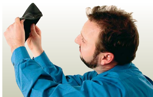
Na prázdnou peněženku si budou muset zvyknout ti, kteří jen zneužívají záclonou síť sociálních dávek a nechtějí pracovat.

V čem tkví podstata změn? V jednoduchém klíči: ruší se přímá návaznost většiny sociálních dávek na výši životního minima. Znamená to, že dávky životního a existenčního minima budou napříště chápány jako ochrana těch, kteří pomoc skutečně potřebují, nikoli jako základ pro výpočet dalších dávek. Odstraňuje se tím každoroční automatická valorizace všech dávek kromě důchodů. Vláda bude mít možnost životní minimum zvýšit, nebude to ale její povinnost. Právě nebezpečný princip na-