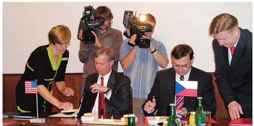
Velvyslanec USA v ČR Richard Graber a vicepremiér a ministr práce a sociálních věcí ČR Petr Nečas podepsali česko-americkou dohodu o sociálním zabezpečení 7. září v budově Ministerstva práce a sociálních věcí ČR v Praze 2, Na Poříčním právu 1.

Velvyslanec USA v ČR Richard Graber a vicepremiér a ministr práce a sociálních věcí ČR Petr Nečas podepsali dohodu, která seje za občanů povinnost plátb sociálního pojištění v obou zemích současně. Občané USA pracující pro americké společnosti v České republice, stejně jako čeští občané pracující pro české firmy v USA, musejí podle platné legislativy plátit sociální pojištění v obou zemích.