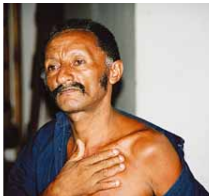
Brazilský dělník ukazuje jizvy, které mu zbyly z doby, kdy byl přinucen pracovat jako otrok.