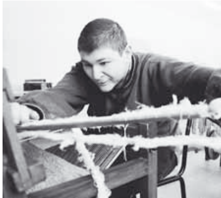
Do ručně tkaných koberců vkládají uživatelé svůj um, soustředění i radost. Fotografie z terapeutické dílny pro lidi s mentálním postižením Eben-Ezer v Horním Zukově.