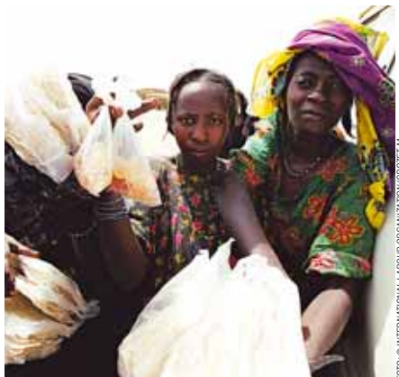
Tyto nigerijské ženy prodávají máslo nedaleko vesnice Ibechtaine. Práci jako otrokyne pro jednu místní rodinu.

Když dochází k násilí na pracovišti, k sexuálnímu obtěžování, šikaně a výhrůžkám, zneužívání moci a dokonce k tělesnému týrání, lidé si kladou otázku, proč se tak děje a co je proti tomu možné dělat. Násilí je však všudypřítomné a často je obtížné ukázat prstem na vlnky.