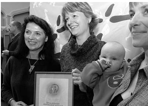
Z předávání certifikátu Společnosti přátelská k rodině