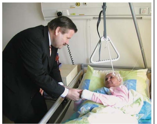
Místopředseda vlády a ministr práce a sociálních věcí Ing. Zdeněk Škromach při návštěvě hospice Citadela ve Valašském Meziříčí