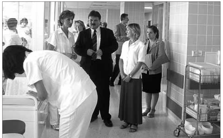
Ministr ve Fakultní nemocnici u sv. Anny v Brně

Úrazové pojištění by ČSSZ spravovala odděleně od ostatních druhů pojištění. Tím se sníží náklady na provoz, správu pojištění a v neposlední řadě také počet neplatících pojistného. To umožní zavedení preventivních aktivit a převzetí výplat starých závazků od roku 1993, kdy bylo úrazové pojištění zavedeno. ČSSZ připraví každý rok pojistný plán, který projedná se zástupci tripartity a poté ho předloží vládě ke schválení.