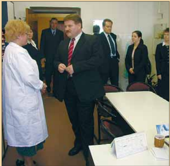
Slavnostní otevření OSSZ ve Frýdku-Místku