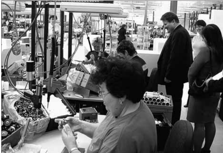
Ministr ve Vyškově při návštěvě firmy BKR, s.r.o.

Po nabytí účinnosti novely by mělo dojít i k zpře-