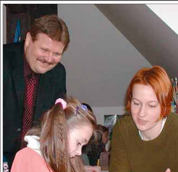
Začátkem února přijal ministr práce a sociálních věcí Zdeněk Škromach pozvání studentů Jedličkova ústavu v Praze.

Od 1. ledna 2004 zavedlo Ministerstvo práce a sociálních věcí (MPSV) na všech úřadech práce program „První příležitost“, který je určen pro mladé uchazeče o zaměstnání do 25 let. Pokračování na straně 4