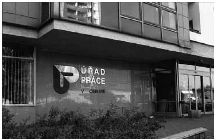
Hlavní budova úřadu práce v Ostravě

Nezaměstnanost v Moravskoslezském kraji má průřezový charakter. Z jednotlivých vzdělanostních skupin nacházejí nejhůře zaměstnání zejména vyučené osoby, další nepočtenější kategorií tvoří lidé se základním vzděláním. Z důvodu všeobecného a trvalého nedostatku volných pracovních míst mají stále vážnější potíže s nalezením práce také vzdělanější vrstvy obyvatelstva - osoby s maturitou a vysokoškolačů. V registrech úřadů práce se ve větším počtu než dříve objevují lidé s vysokou kvalifikační úrovní a úzkou profesní spe-