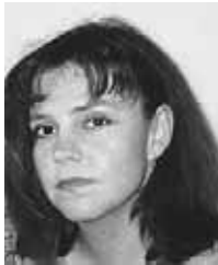
Mgr. Michaela Marksová-Tominová

V praxi to znamená posuzovat, zda občasná návštěva rodičů v domově je skutečně oním opravdovým zájmem, kvůli kterému není možné dítě umístit do náhradní rodiny. Takové případy ale nemohou ministerští úředníci nijak ovlivnit, protože posuzování opravdového zájmu o děti přísluší pouze soudu. Jediné, co je v moci našeho ministerstva, je zjistit, jak jsou takové případy posuzovány, s jakými výsledky a jak dlouho soudům trvá v nich rozhodnout.