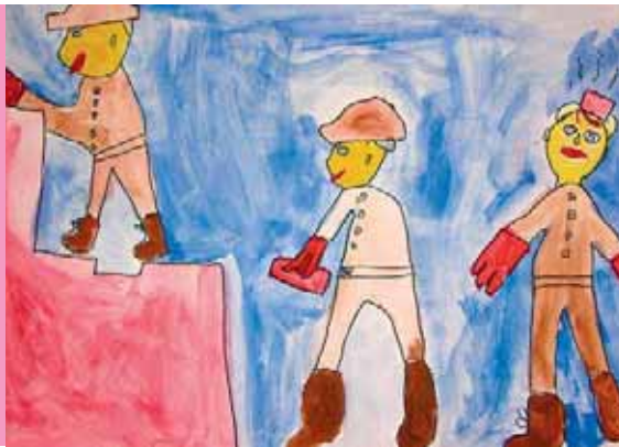
Vítězná kresba Matěje Rezka