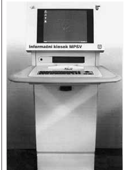
Úřady práce budou během letošního roku vybaveny těmito novými moderními informačními kioskami, ze kterých je možné navštívit i webové stránky EURES

Na všech úřadech práce jsou veřejně přístupné samoobslužné informační kiosky a počítače, na kterých jsou webové stránky EURES přístupné.