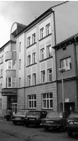
Budova Úřadu práce v Českých Budějovicích

Ve II. pololetí roku 2004 lze očekávat růst míry nezaměstnanosti v kraji. Do evidence úřadů práce přicházejí především absolventi škol a již tradičně od měsíce října i osoby vracející se ze sezonních prací ve službách a v stavebnictví, kterým končí pracovní poměr na dobu určitou. Předpokládáme, že i poptávka zaměstnavatelů bude zejména