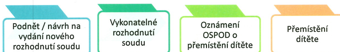
Schéma přemístění dítěte, které bylo do péče ZDVOP umístěno rozhodnutím soudu:

Ke splnění zákonných podmínek pro přemístění dítěte nepostačuje , pokud: