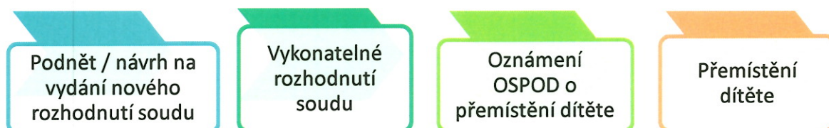
Schéma přemístění dítěte, které bylo do péče ZDVOP umístěno rozhodnutím soudu:

Ke splnění zákonných podmínek pro přemístění dítěte nepostačuje , pokud: