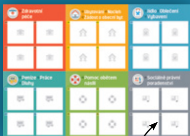
Předtištěná šablona letáku

Samolepící štítky s kontakty, které jste doplnili