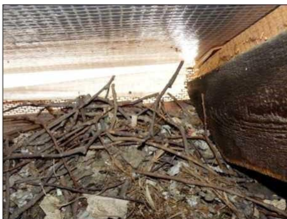
Hnízdo kavky se skládá z hrubšího materiálu, převážně větvíček dřevin rostoucích v okolí