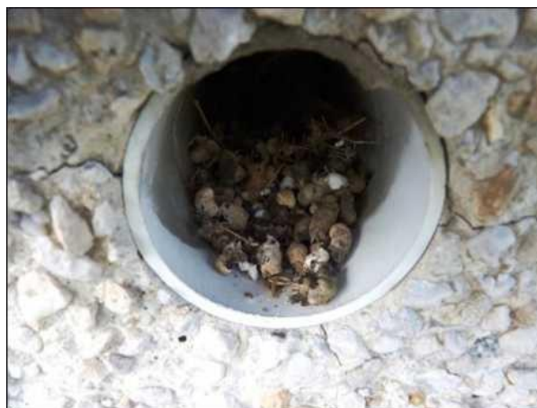
Trus drobných pěvců v ústí ventilačního otvoru