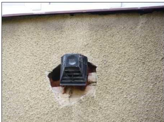
Nezačištěné okraje odvětrání podokenního hnízdiště rorýse obecného