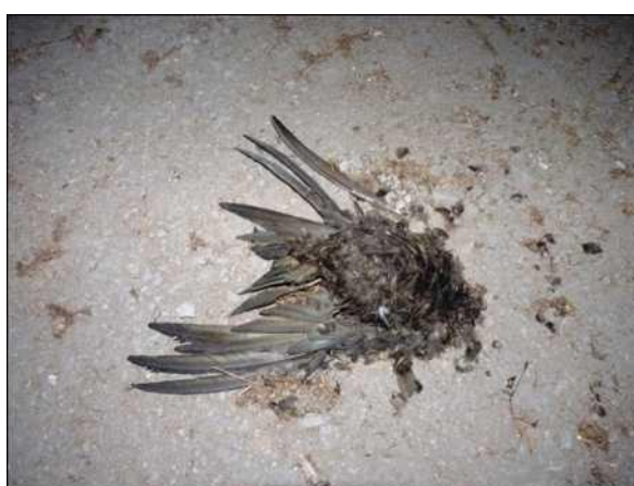
Uhynulý rorýs na podlaze půdy