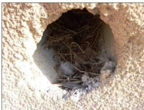
Hnízdní materiál, vypadávající z hnízda vrbců