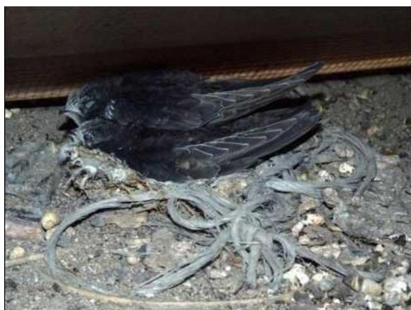
Rorýsi často hnízdo nestaví, spokojí se s materiálem, který v dutině naleznou