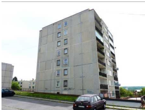
Panelový bytový dům