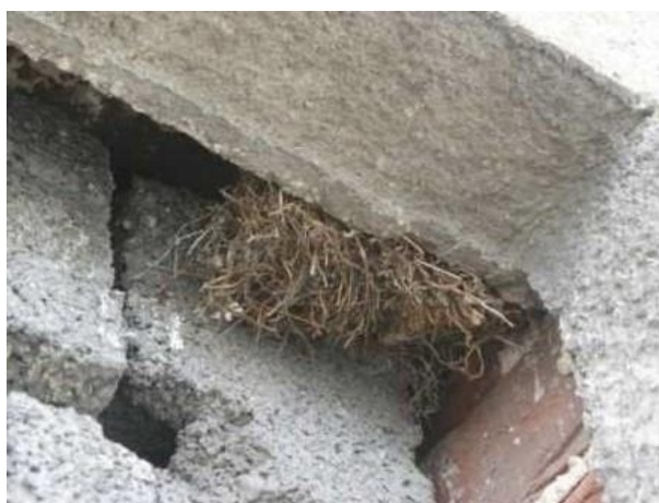
Hnízda vrabců obsahující velké množství hnízdního materiálu