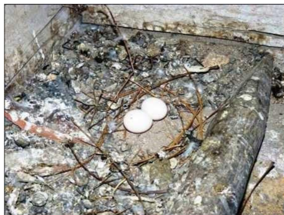
Hnízdo holuba věžáka je většinou nedokončené