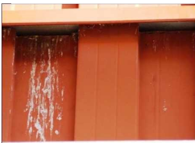
Prostor pod vletovým otvorem pěvců je často znečištěn trusem