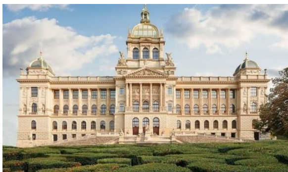
Historická budova Národního Muzea