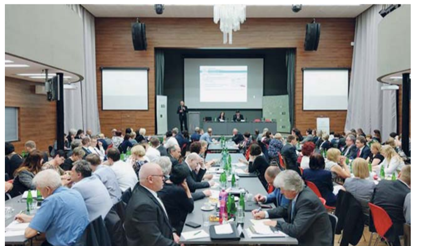
Celorepublikové setkání vedení ústředí České správy sociálního zabezpečení a všech okresních správ sociálního zabezpečení, kterého se zúčastnila i ministryně práce a sociálních věcí Jaroslava Němcová, se konalo 16. a 17. dubna.