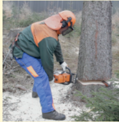
Autor: Bc. Jakub Hrnčířik

Základní podmínky uzavírání pracovněprávních vztahů, práva a povinnosti zaměstnance i zaměstnavatele jsou stanoveny zákonem č. 262/2006 Sb., zákoník práce, ve znění pozdějších předpisů. Jedná se o podmínky výkonu závislé práce ve vztahu mezi zaměstnancem a zaměstnavatelem včetně požadavků na zajištění bezpečnosti a ochrany zdraví při práci. Na osoby, které nejsou účastníky pracovněprávního vztahu (např. osoby samostatně výdělečně činné), se vztahují vybraná ustanovení zákoníku práce týkající se bezpečnosti a ochrany zdraví při práci (dále jen „BOZP“) na základě požadavku § 12 zákona č. 309/2006 Sb., o zajištění dalších podmínek bezpečnosti a ochrany zdraví při práci, ve znění pozdějších předpisů. Jedná se především o § 101 odst. 1 a 2, § 102, 104 a 105 zákoníku práce a § 2 až 11 zákona č. 309/2006 Sb., ve znění pozdějších předpisů, s přihlédnutím k podmínkám vykonávané činnosti nebo poskytování služeb a jejich rozsahu. V tomto ohledu se tudíž mnoho živnostníků mylně domnívá, že se na ně zákoník práce nevztahuje. Bezpečnost a ochrana zdraví při práci v lese, způsob organizace práce a pracovních postupů, které je zaměstnavatel povinen zajistit při práci v lese a na pracovištích obdobného charakteru jsou řešeny v nařízení vlády č. 28/2002 Sb.